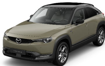
49T Zircon Sand