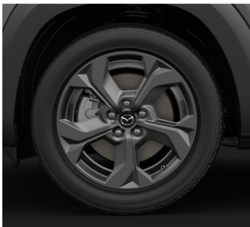
18 colių skersmens lengvojo lydinio ratlankiai (215/55R18), „Grey Metallic“ stiliaus apdaila