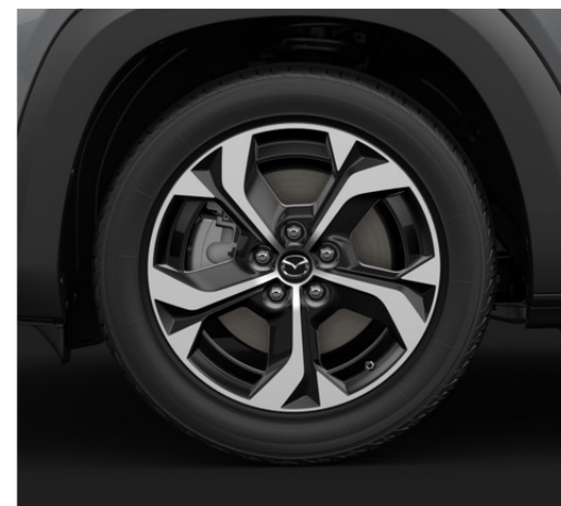
18 colių skersmens lengvojo lydinio ratlankiai (215/55R18), „Black Diamond Cut“ stiliaus apdaila