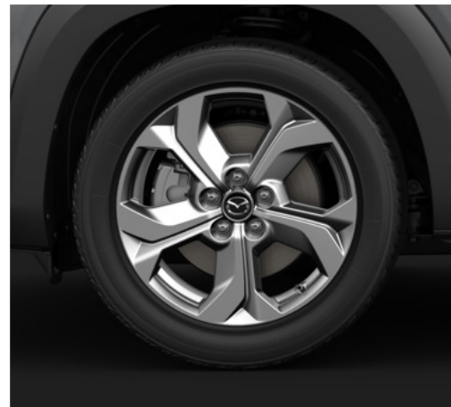
18 colių skersmens lengvojo lydinio ratlankiai (215/55R18), „Bright“ stiliaus apdaila