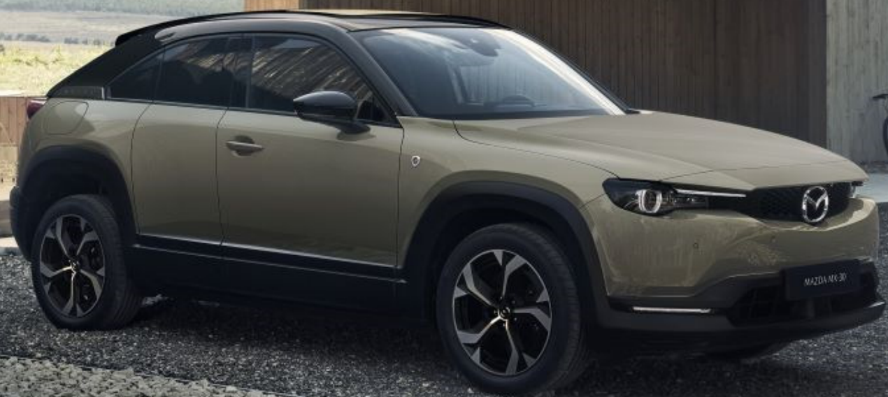
MAZDA MX-30 R-EV MAKOTO, ZIRCON SAND