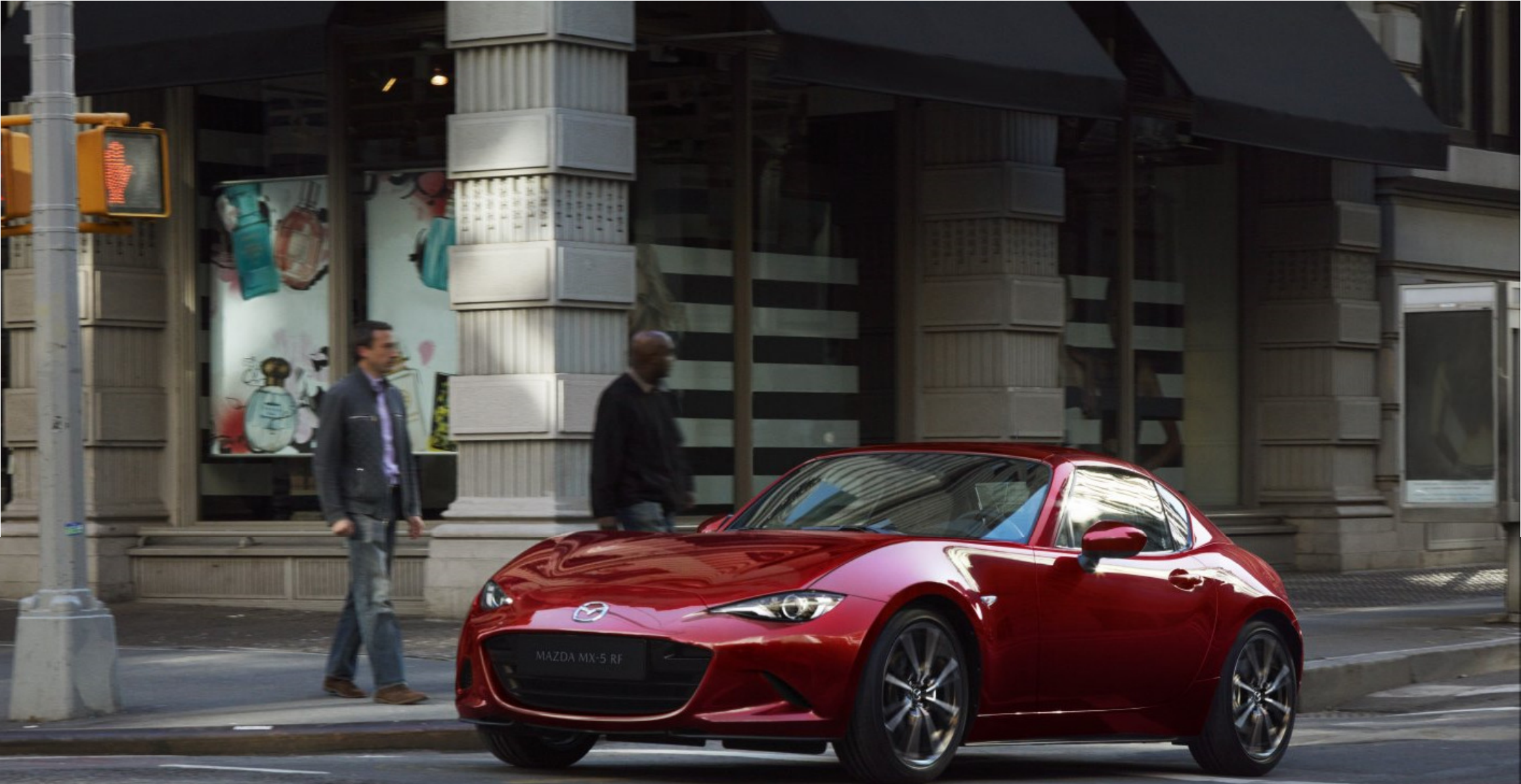
MAZDA MX-5 RF, EXCLUSIVE-LINE, SOUL RED CRYSTAL