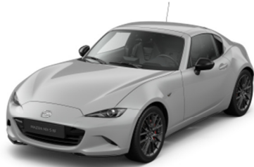
52C Aero Gray