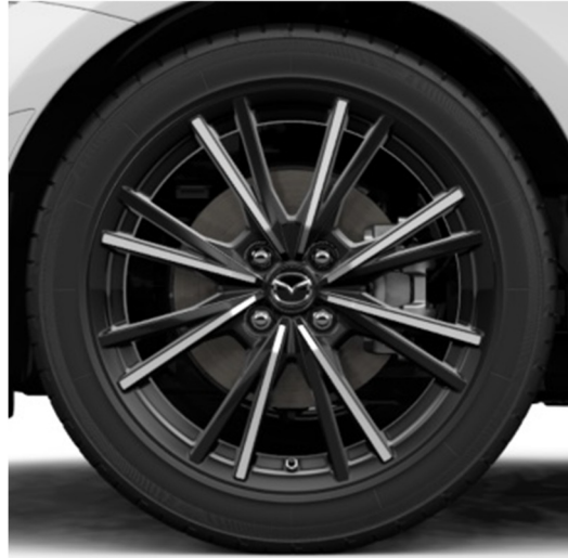
EXCLUSIVE-LINE & KAZARI

16 colių skersmens lengvojo lydinio ratlankiai (195/50R16), „Black“ stiliaus apdaila