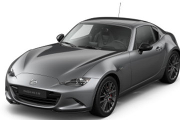
46G Machine Gray