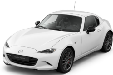
A4D Arctic White