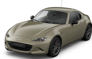
48T Zircon Sand (Negalima Kazari soft-top klasės)