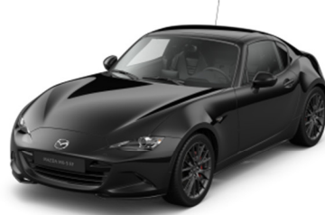
41W Jet Black (Negalima Kazari RF klasės)