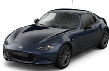
42M Deep Crystal Blue