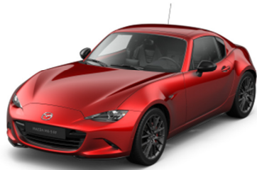
46V Soul Red Crystal (Negalima Kazari soft-top klasės)