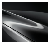
46G „Machine Gray“