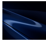
42M „Deep Crystal Blue“