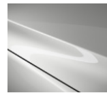
A4D „Arctic White“

Blizgių dažų „Metallic“ variantai, 800 €