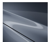
47C „Polymetal Gray“