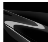
41W „Jet Black“