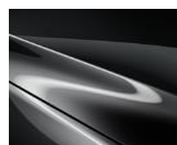
46G „Machine Gray“