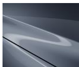
47C „Polymetal Gray“

Blizgių dažų „Metallic“ variantai, 500 €