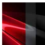
47E „Soul Red Crystal“