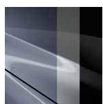
47L „Polymetal Gray“