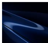
42M „Deep Crystal Blue“