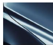
45B „Eternal Blue“