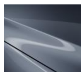
47C „Polymetal Gray“