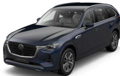
42M Deep Crystal Blue