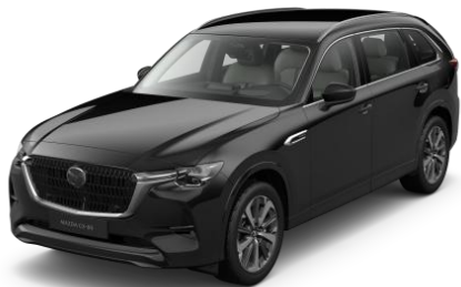
41W Jet Black

Blizgių dažų „Metallic“ variantai (850€)