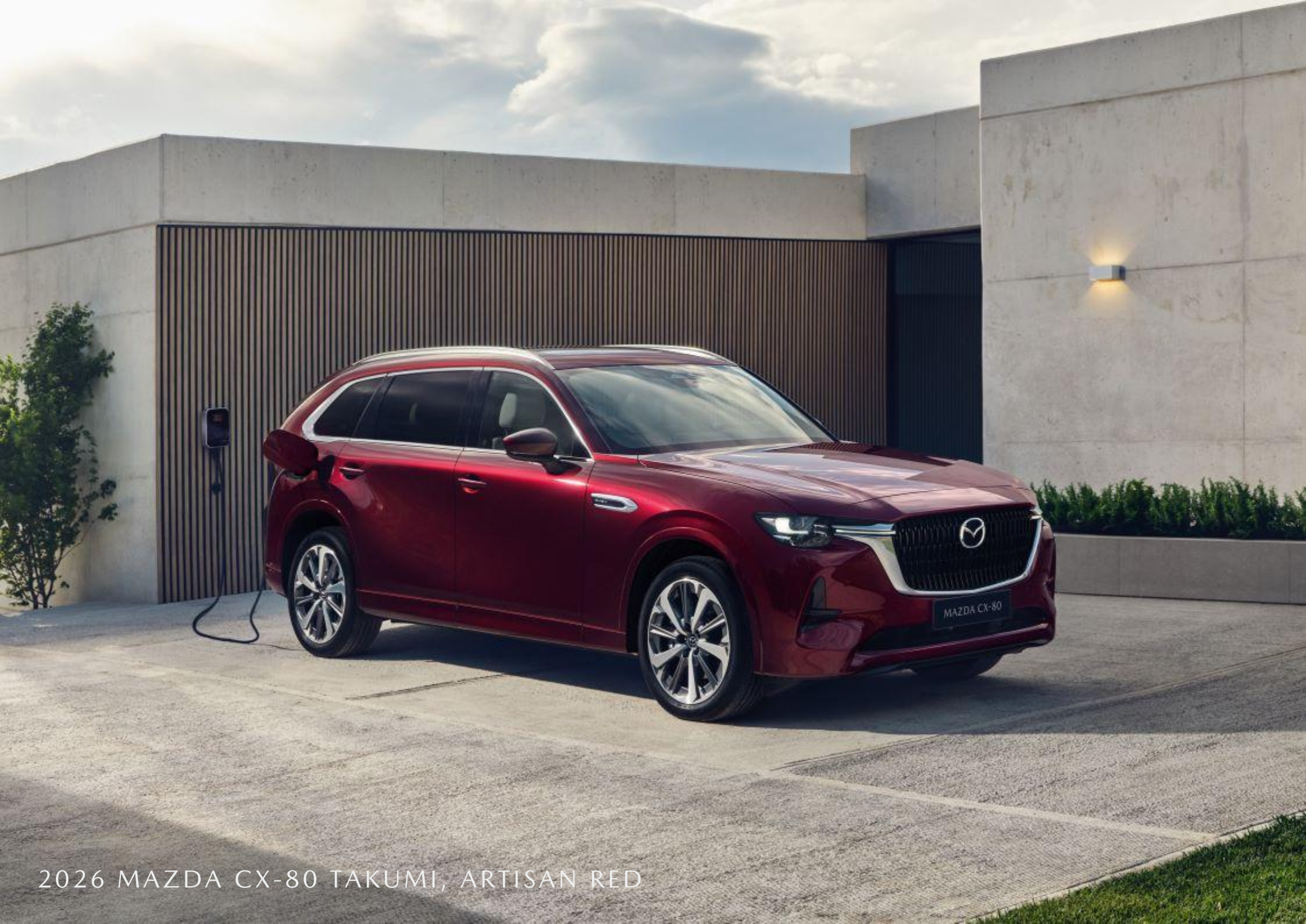
2026 MAZDA CX-80 TAKUMI, ARTISAN RED