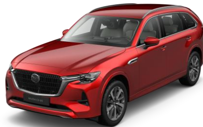
46V Soul Red Crystal