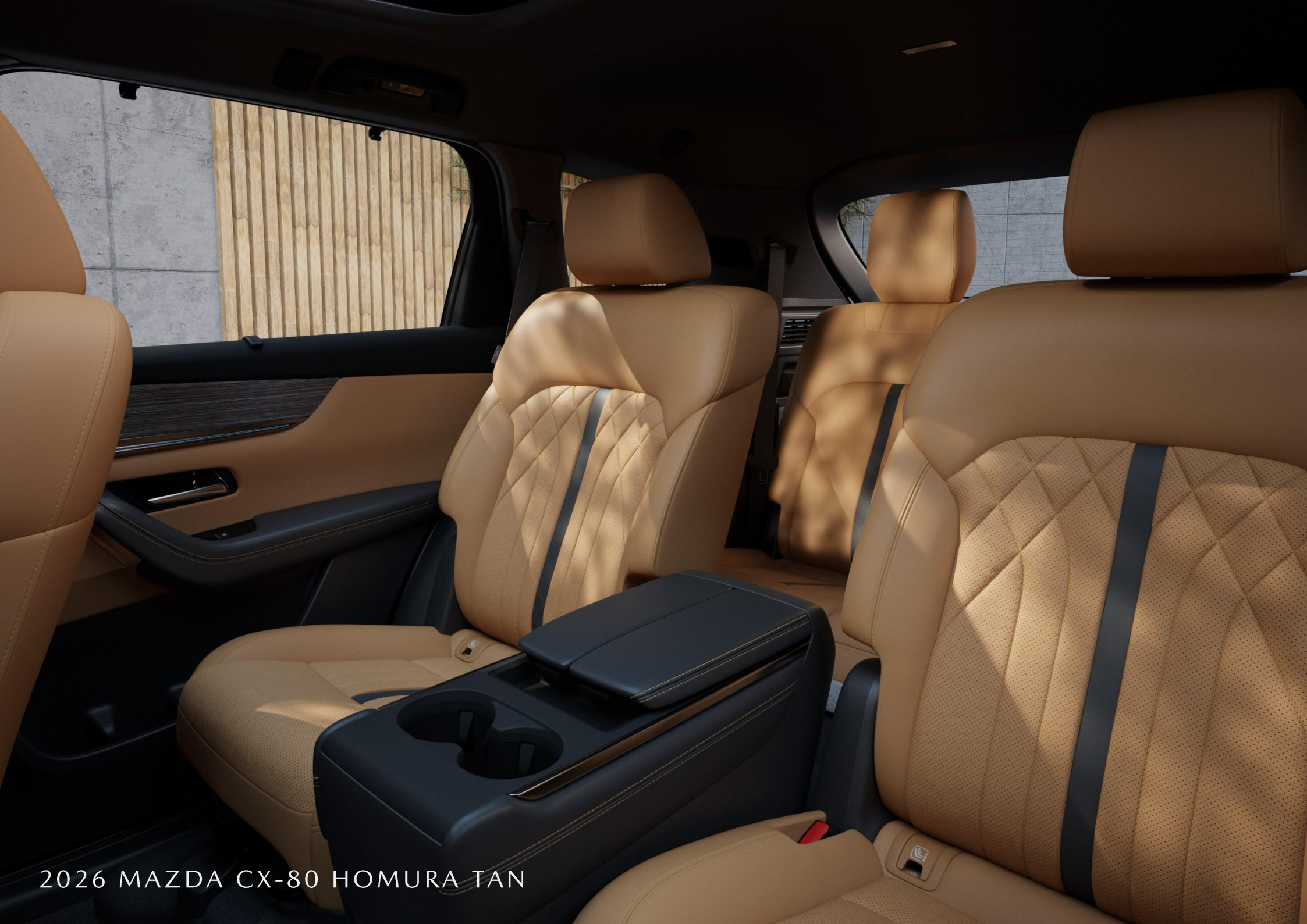
2026 MAZDA CX-80 HOMURA TAN