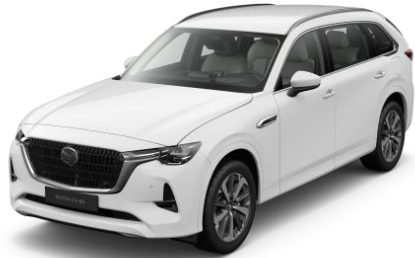
A4D Arctic White

Blizgių dažų „Metallic“ variantai (850€)