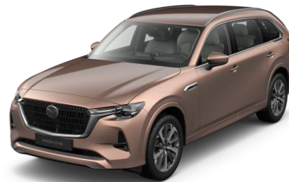
52H Melting Copper