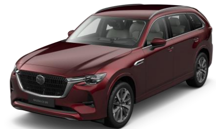
51F Artisan Red