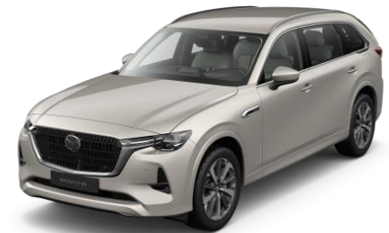
47S Platinum Quartz

Blizgūs dažai „Premium Metallic“ (1 100€)