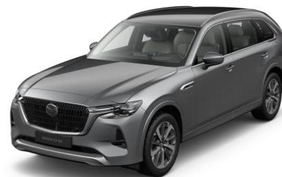
46G Machine Gray