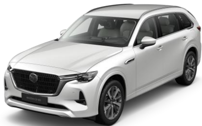
51K Rhodium White

Blizgūs dažai „Premium Metallic“ (1 100€)