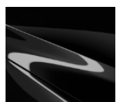
41W „Jet Black“