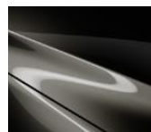
42S „Titanium Flash“