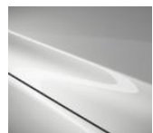
25D „Snowflake White Pearl“

Blizgių dažų „Metallic“ variantai, 500 €