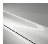
A4D „Arctic White“

Blizgių dažų „Metallic“ variantai, 500 €