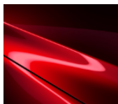
46V „Soul Red Chrystal“