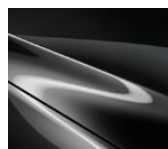
46G „Machine Gray“