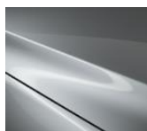
45P „Sonic Silver“