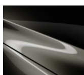
42S „Titanium Flash“