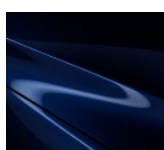
42M „Deep Chrystal Blue“