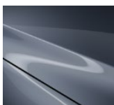
47C „Polymetal Gray“

Blizgių („Metallic“) dažų variantai (500 €)