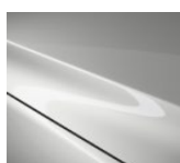
A4D „Arctic White“

Blizgių („Metallic“) dažų variantai (500 €)