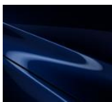
42M „Deep Crystal Blue“