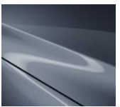
47C „Polymetal Gray“