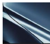
45B „Eternal Blue“