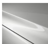
A4D „Arctic White“

Blizgių dažų „Metallic“ variantai, 400 €